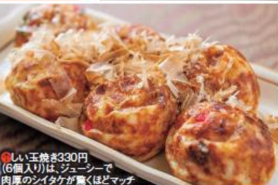
⑨しい玉焼き330円(6個入り)は、ジューシーで肉厚のシイタケが驚くほどマッチ

南山城村の特産物を販売する「南山城村農林産物直売所」内にある食事処。うどんやカレーをはじめとした軽食や、たこ焼の形をした「しい玉焼き」が看板商品。タコの代わりに、原木シイタケの佃煮を生地の中に入れたしい玉焼きは、午前みの販売。→P6