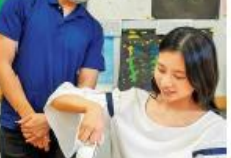
② 道の駅で販売する「純煎」を使用、ティーアンバサダーが教えてくれる

体験データ おいしいお茶の淹れ方体験 料金 1800円 (2人以上で要事前予約) 所要 約30分 期間 通年