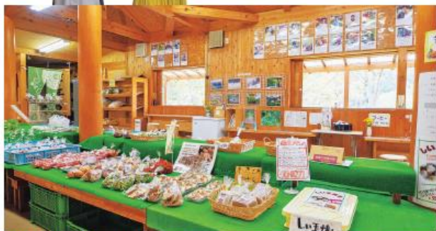
⑧檜や杉を使った椅子と机を配した店内席と、木津川を見ながらいただける屋外の席も

南山城村のお茶や野菜を使ったおいしいグルメがいっぱい! 定番グルメを南山城村風にアレンジするなど、 個性的なメニューを堪能しよう。