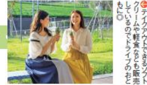
⑤テイクアウトできるソフトクリームや軽食なども販売している。ドライブの思い出に。

まずは、自然豊かな南山城村の特産物を販売する道の駅へ。物販のみでなく、食堂やカフェではお茶を使った創作メニューが楽しめる。→P5・6