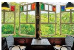
⑩離れの窓から見える緑が美しい。バーの営業やコンサートの開催も予定している