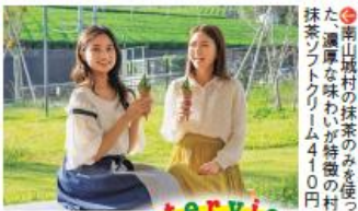
⑦南山城村の抹茶のみを使った、濃厚な味わいが特徴の村抹茶ソフトクリーム410円