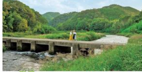
④ドラマのロケ地になったことでも有名。川の増水時は橋が沈むので注意して

緑結びのご利益で知られる恋志谷神社へと続く沈下橋。この橋を渡って参拝すると、願いが叶うといわれている。山と川に囲まれた風景がフォトジェニック。