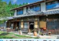
① 古民家を改装した、緑のあるたたずまいがすてき。緑側でのんびりしても

緑あふれる自然の中にたたずむ陶芸工房。陶芸にふれるきっかけづくりをしたいと、豆血作り体験や陶器品の販売を行う。近隣のクラフトフェアなどに出席することもある。 ① 南山城村北大河原辻押原3 ② JR月ヶ瀬口駅から徒歩5分 ③ 不定休 ④ 2台