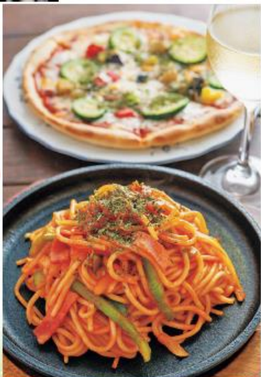
⑬自家製ベジタブルピザ900円、ナポリタン800円。ワインとの相性も◎

⑪南山城村北大河原下谷27 ⑫JR月ヶ瀬口駅から車で4分 ⑬9時30分~18時30分 ⑭月曜 ⑮20台