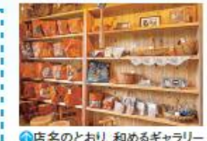
① 店名のとおり、和めるギャラリー

体験データ おいしいお茶の淹れ方体験 料金 1800円 (2人以上で要事前予約) 所要 約30分 期間 通年