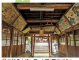
⑨石段の上に本堂へと続く簾所があり、絵馬などが奉納されている

室町時代の建立といわれ、田山地区の氏神として信仰される。11月3日に雨乞いや五穀豊穡を祈る伝統行事「田山花踊り(→P2)」が行われる。